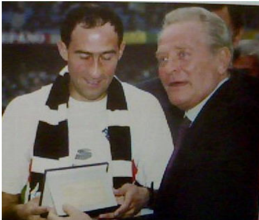
Due grandi dell'Atletica Piemontese